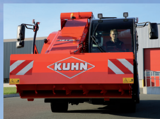
Широкий конвейер (650 мм) для максимальной производительности

Автоматическое управление фрезерной головкой при нарезке силоса: структура корма сохраняется