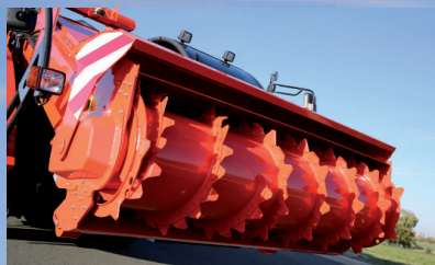
Фрезерная головка для загрузки всех видов корма (мощность: 90–120 л. с.)

Самоходные прицепные смесители с одним вертикальным шнеком